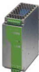
24V DC/5A DIN导轨安装式电源，初级开关模式，单相

Please be informed that the data shown in this PDF Document is generated from our Online Catalog. Please find the complete data in the user's documentation. Our General Terms of Use for Downloads are valid ( http://download.phoenixcontact.com )