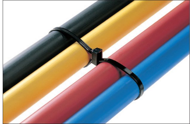
Parallele bundeling met bundelbanden uit de DH-serie.