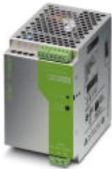
DIN导轨安装式电源，初级开关模式，1相，输出：24V DC/5A

Please be informed that the data shown in this PDF Document is generated from our Online Catalog. Please find the complete data in the user's documentation. Our General Terms of Use for Downloads are valid ( http://download.phoenixcontact.com )