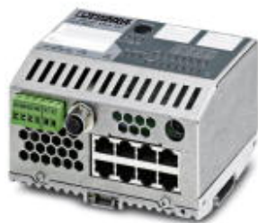
以太网紧凑智能管理型交换机，带8个10/100/1000 Mbps RJ45端口

Please be informed that the data shown in this PDF Document is generated from our Online Catalog. Please find the complete data in the user's documentation. Our General Terms of Use for Downloads are valid ( http://download.phoenixcontact.com )