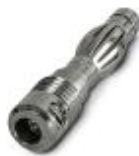
测试插头，颜色: 银色