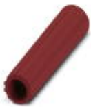
绝缘套管，颜色: 红色