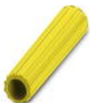
绝缘套管，颜色: 黄色