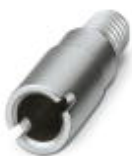
测试孔式连接器，颜色: 银色