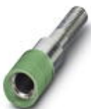
测试孔式连接器，颜色: 绿色