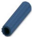
绝缘套管，颜色: 蓝色