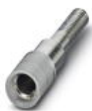
测试孔式连接器，颜色: 灰色