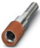
测试孔式连接器，颜色: 红色