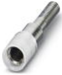
测试孔式连接器，颜色: 白色