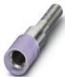
测试孔式连接器，颜色: 紫色