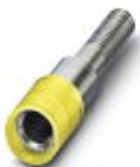
测试孔式连接器，颜色: 黄色