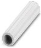
绝缘套管，颜色: 白色