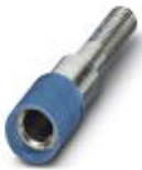
测试孔式连接器，颜色: 蓝色