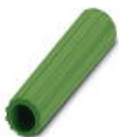
绝缘套管，颜色: 绿色