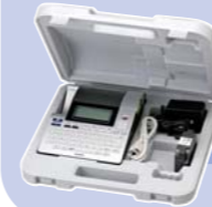
Inklusive TZ-Schriftbandkassette, Netzadapter und Aufbewahrungskoffer

PC/Mac Anschluss – Ist das P-touch 2700 an den PC/Mac angeschlossen, können über die P-touch Editor Software auch eigene Logos oder Grafiken in das Etikett integriert werden.