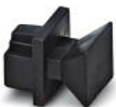
RJ45 孔式连接器的防尘盖