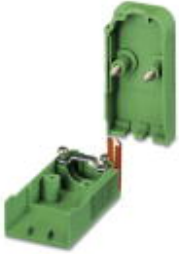
电缆插头外壳， 针距: 0 mm， 位数: 3， 尺寸a: 24.66 mm， 颜色: 绿色

Please be informed that the data shown in this PDF Document is generated from our Online Catalog. Please find the complete data in the user's documentation. Our General Terms of Use for Downloads are valid ( http://download.phoenixcontact.com )