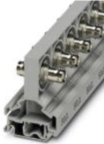
BNC连接器，单级，用于安装在NS 32或者NS 35/7.5上，波阻抗：50 欧姆

Please be informed that the data shown in this PDF Document is generated from our Online Catalog. Please find the complete data in the user's documentation. Our General Terms of Use for Downloads are valid ( http://download.phoenixcontact.com )