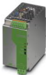
AS接口电源单元，4.8 A，集成式接地故障探测器，IP20防护等级

Please be informed that the data shown in this PDF Document is generated from our Online Catalog. Please find the complete data in the user's documentation. Our General Terms of Use for Downloads are valid ( http://download.phoenixcontact.com )