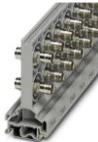
BNC连接器，双级，用于安装在NS 32或者NS 35/7.5上，波阻抗：50 欧姆

Please be informed that the data shown in this PDF Document is generated from our Online Catalog. Please find the complete data in the user's documentation. Our General Terms of Use for Downloads are valid ( http://download.phoenixcontact.com )