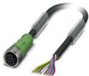
传感器/执行器电缆，8-芯，PUR 无卤素，黑-灰色 RAL 7021，端自由出线，与孔式直头 M12，A编码，电缆长度: 3 m

Please be informed that the data shown in this PDF Document is generated from our Online Catalog. Please find the complete data in the user's documentation. Our General Terms of Use for Downloads are valid ( http://download.phoenixcontact.com )