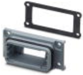
D-SUB面板安装框架，外壳尺寸1，IP67防护等级