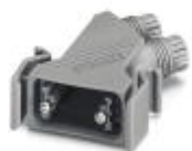
D-SUB插头外壳, 保护等级: IP67, 标识材料: PA, 电缆出口: 弯头, 外壳尺寸: 1, 颜色: 灰色