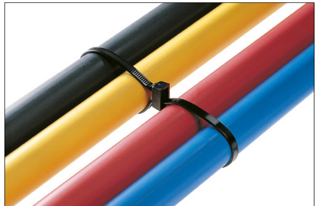
Legatura di due cablaggi paralleli con fascette della serie DH.