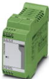
用于DIN导轨安装的MINI POWER电源，初级开关模式，输入：1相，输出：2x 15 V DC/1 A

Please be informed that the data shown in this PDF Document is generated from our Online Catalog. Please find the complete data in the user's documentation. Our General Terms of Use for Downloads are valid ( http://download.phoenixcontact.com )