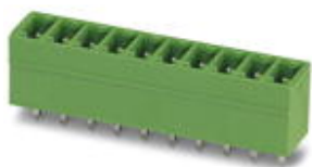
图为10位穿墙式连接器

印刷线路板壳体，标称工作电流: 8 A，位数: 4，针距: 3.81 mm，颜色: 绿色，触点表面: 锡，安装: 波峰焊