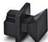
RJ45 孔式连接器的防尘盖