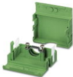
电缆插头外壳， 针距: 0 mm， 位数: 5， 尺寸a: 25 mm， 颜色: 绿色

Please be informed that the data shown in this PDF Document is generated from our Online Catalog. Please find the complete data in the user's documentation. Our General Terms of Use for Downloads are valid ( http://download.phoenixcontact.com )