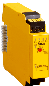
图片可能存在偏差