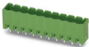
图为10位穿墙式连接器

印刷线路板壳体，标称工作电流: 12 A，位数: 3，针距: 5.08 mm，颜色: 绿色，触点表面: 锡，安装: 波峰焊