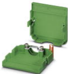
电缆插头外壳，针距: 3.81 mm，位数: 14，尺寸a: 55.73 mm，颜色: 绿色

Please be informed that the data shown in this PDF Document is generated from our Online Catalog. Please find the complete data in the user's documentation. Our General Terms of Use for Downloads are valid ( http://download.phoenixcontact.com )