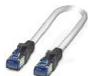
尾缆 , CAT6 , 预制 , 0.3 m