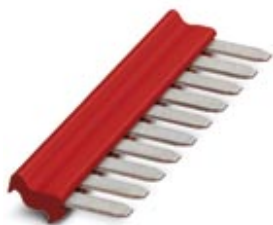
插拔式桥接件， 针距: 5.2 mm， 位数: 10， 颜色: 红色

Please be informed that the data shown in this PDF Document is generated from our Online Catalog. Please find the complete data in the user's documentation. Our General Terms of Use for Downloads are valid ( http://download.phoenixcontact.com )