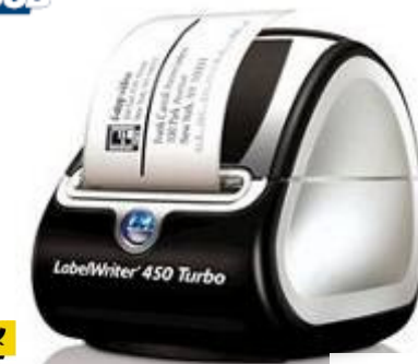
LabelWriter 450 Turbo