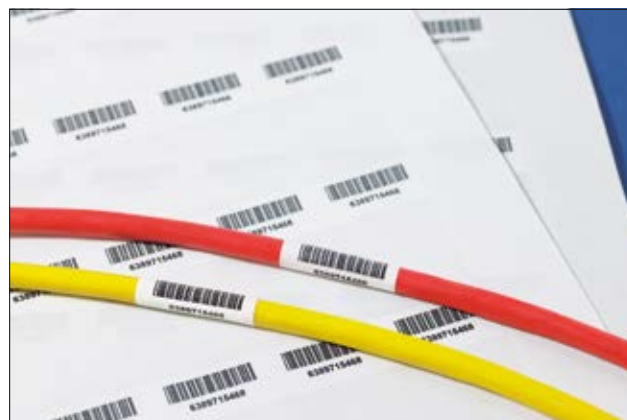
Helatag sorgt für die dauerhafte Kennzeichnung von Kabeln mit Barcodes.