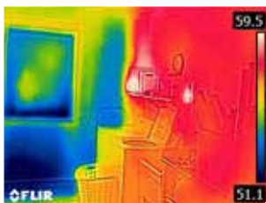
保温性能差的外墙