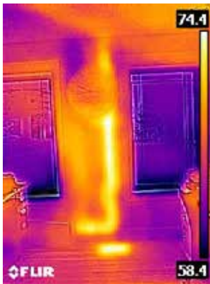
墙壁中的热水排水管