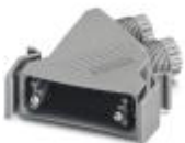
D-SUB插头外壳，外壳尺寸3，IP67防护等级