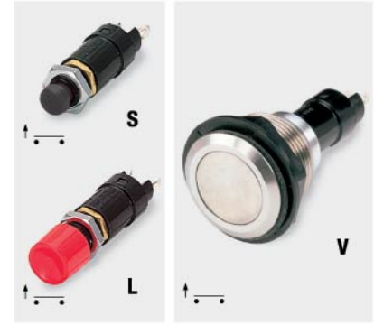
T0916SO --- & T0916LO ---