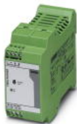
用于DIN导轨安装的MINI POWER电源，初级开关模式，输入：1相，输出：24 V DC/2 A

Please be informed that the data shown in this PDF Document is generated from our Online Catalog. Please find the complete data in the user's documentation. Our General Terms of Use for Downloads are valid ( http://download.phoenixcontact.com )