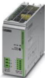
用于DIN导轨安装的TRIO POWER电源，初级开关模式，输入：1相，输出：24 V DC/10 A

Please be informed that the data shown in this PDF Document is generated from our Online Catalog. Please find the complete data in the user's documentation. Our General Terms of Use for Downloads are valid ( http://download.phoenixcontact.com )